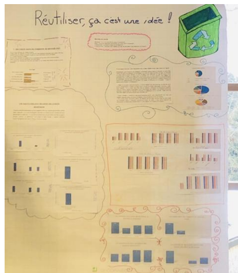
Leçon de mathématique sur les diagrammes en Montessori